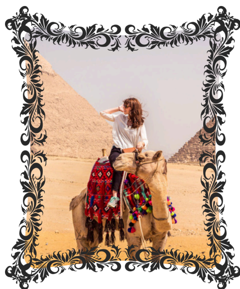
LAS PIRÁMIDES DE GIZA

Desayuno en el hotel. Salida para realizar la visita a las Tres Pirámides de Giza; Keops, Kefrén y Micerinos, que son considerados una de las Siete Maravillas del Mundo que te dejarán boquiabierto ante la grandeza de su construcción. Si miras a tu alrededor, podrás ver la asombrosa Esfinge con cabeza de humano y cuerpo de león. Junto a él encontrarás el Templo del Valle dedicado al espíritu sagrado de Kefrén con el fin de proporcionar comidas y ofrendas al Faraón.