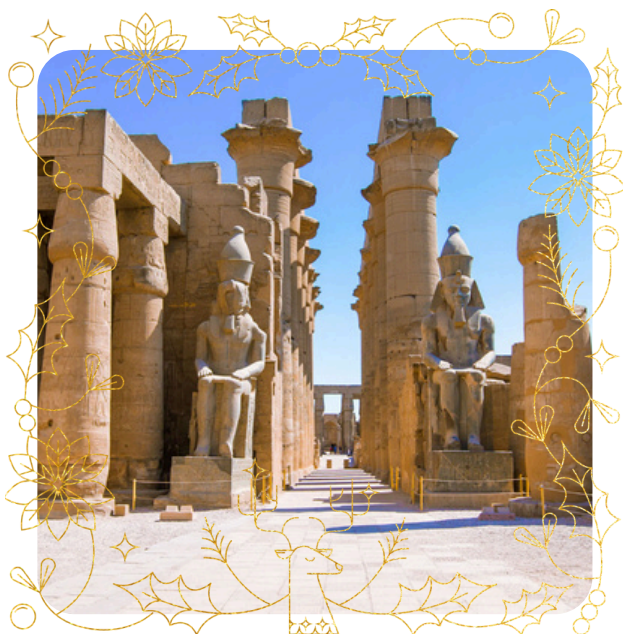
TEMPLO DE LUXOR

Vivir una aventura única que requiere un corazón de acero volando encima de los templos en un globo aerostático.