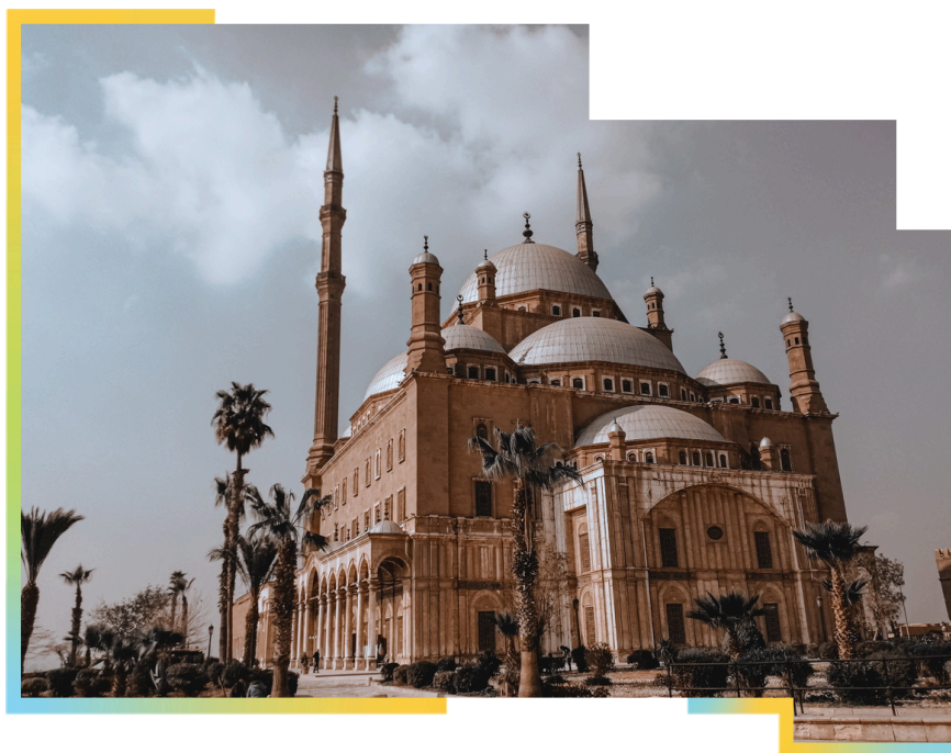
MEZQUITA DE MUHAMAD ALI